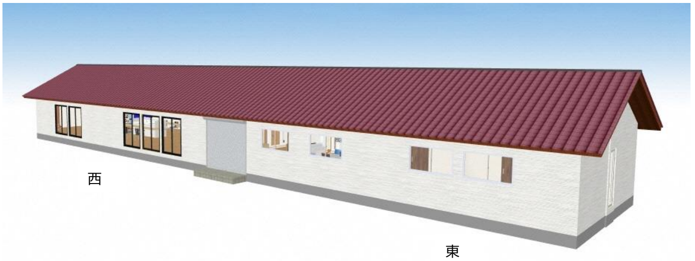
イメージ図：オフィス2（24.05㎡）